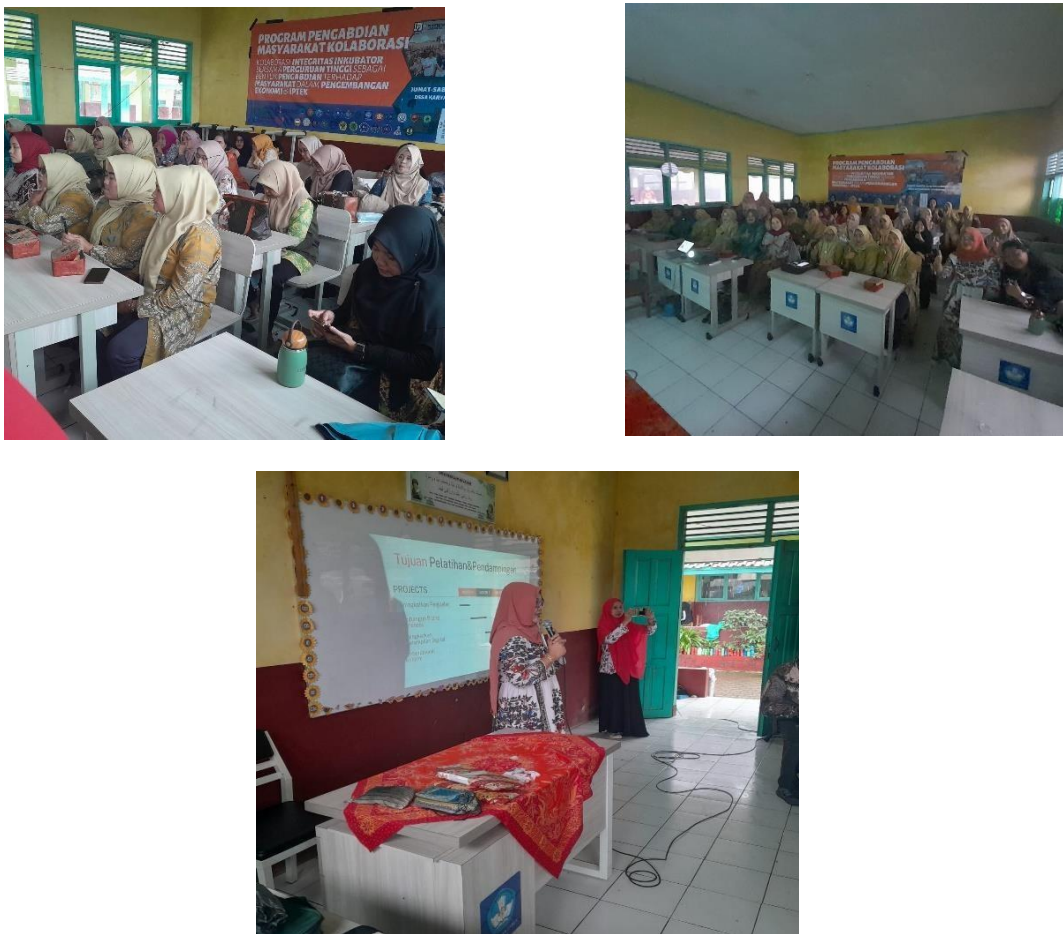
Gambar 2. Dokumentasi kegiatan PKM di ruang 1 SDN Karyamekar 2 Pasirwangi, Kab. Garut