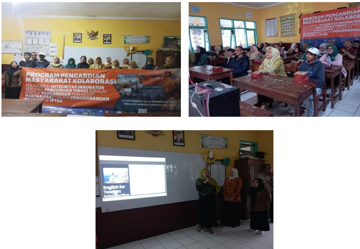
Gambar 2. Dokumentasi kegiatan PKM di ruang 3 SDN Karyamekar 2 Pasirwangi, kab. Garut