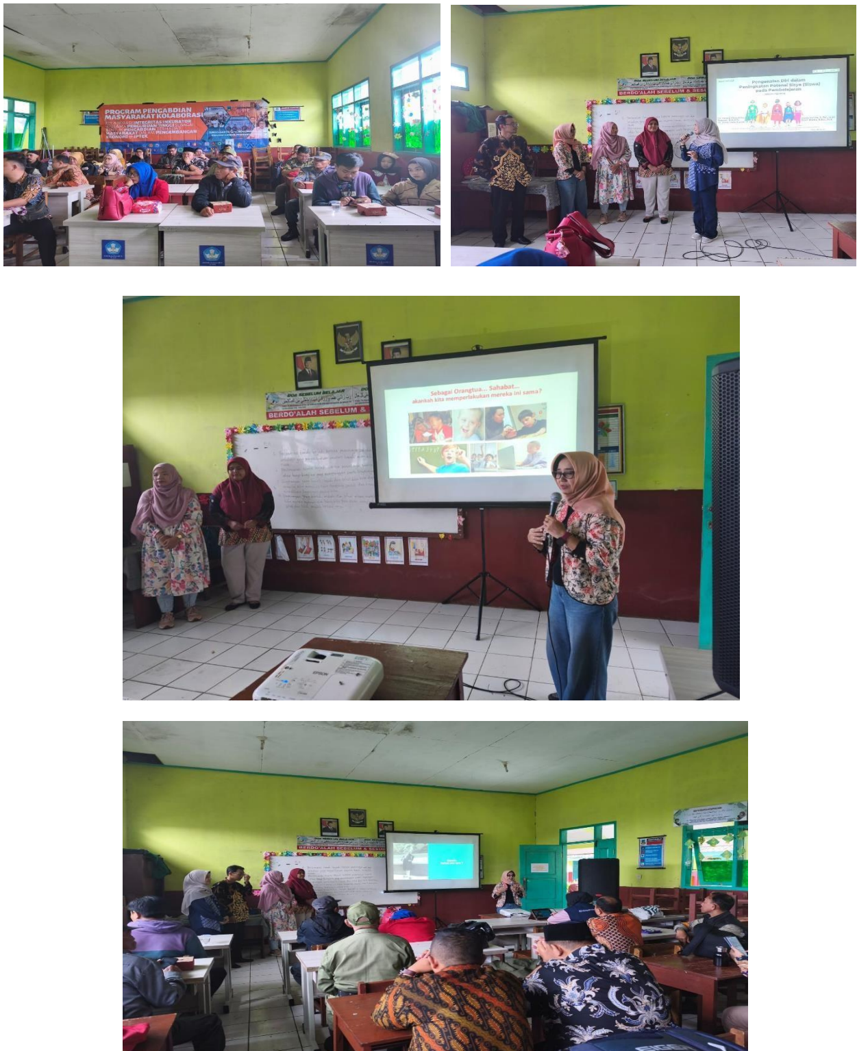
Gambar 2. Dokumentasi kegiatan PKM di ruang 2 SDN Karyamekar 2 Pasirwangi, Kab. Garut